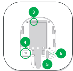
3 - Netzanschluss 4 - QR-Code 5 - Manipulationstaste 6 - Netzschalter