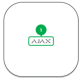
1 - Logo mit Leuchtanzeige