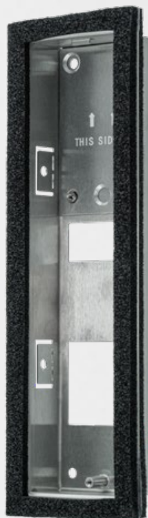
D1102FV Fingerprint 50 Boîtier de montage arrière (encastré)