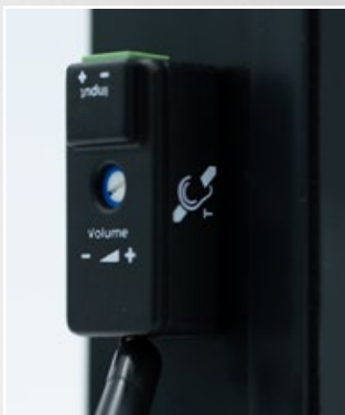
Module de boucle auditive inclus

REMARQUE IMPORTANTE : Veuillez prendre connaissance des notes et dessins techniques afin d'éviter de perdre la garantie de votre appareil.